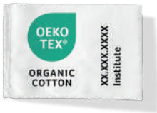
100 % Organic cotton