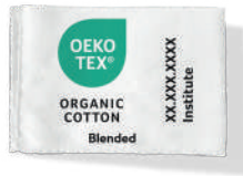
Minimum 70 % Organic cotton